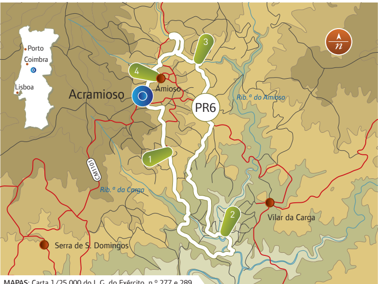
MAPAS: Carta 1/25.000 do I. G. do Exército, n.º 277 e 289