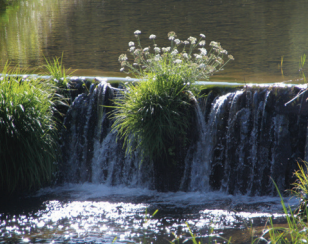
Queda de Água